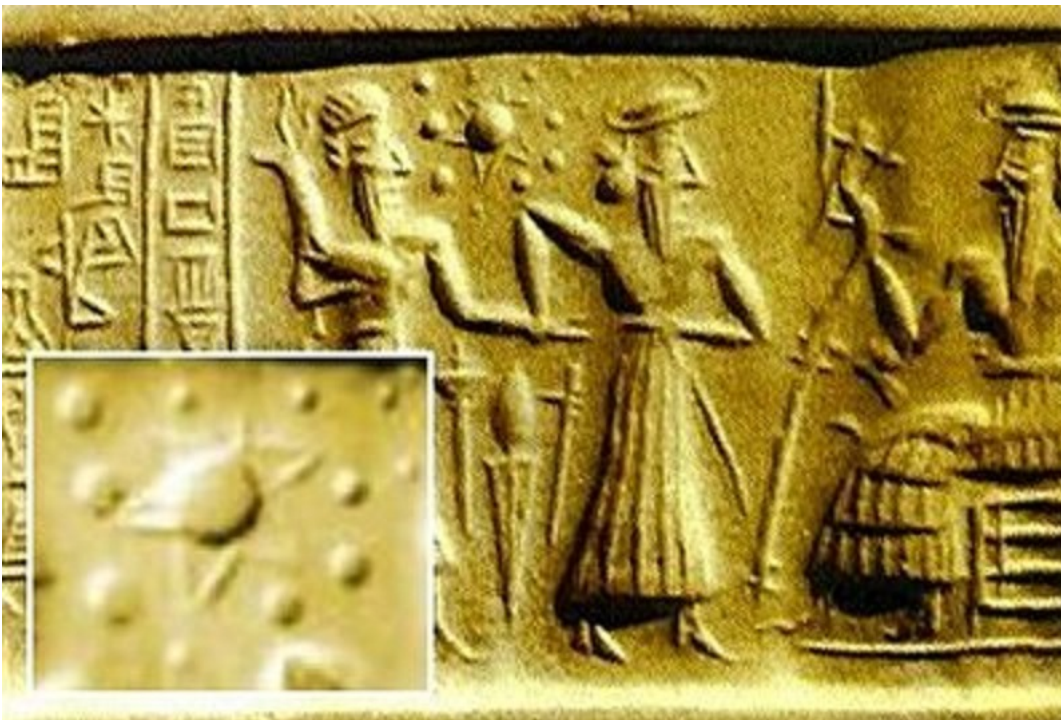
Sigillo accadico del III millennio a.C. ora conservato nel Vorderasiatische Abteilung del Museo di Stato di Berlino Est (catalogato VA/243)

Abbiamo visto che la nostra civiltà ha scoperto Plutone nel 1930, ma i reperti astrologici di altre civiltà ci dimostrano che questo pianeta era conosciuto già da molto tempo prima, nonostante fosse invisibile ad occhio nudo. La civiltà sumerica iniziata prima del 3500 a.C. evidenziava già questa conoscenza. Le tavolette sumeriche di argilla, scoperte nell'800 e interpretate più tardi, ne hanno offerta documentazione con descrizioni particolareggiate e sigilli incontestabili, depositati ora in vari musei del mondo.